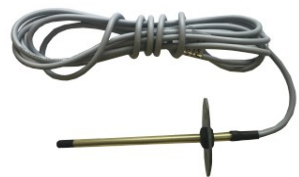
2 pav./figure 2