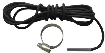
2 pav./figure 2